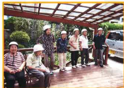
まつなみクラブにて防災訓練