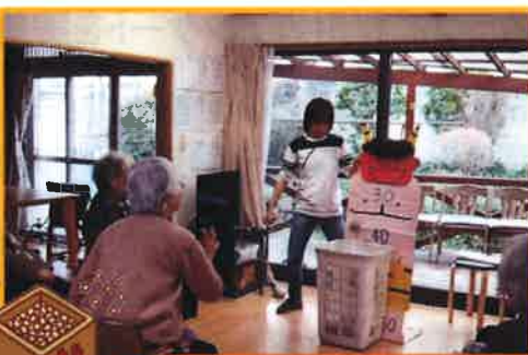
新聞紙で丸めたボールで鬼退治