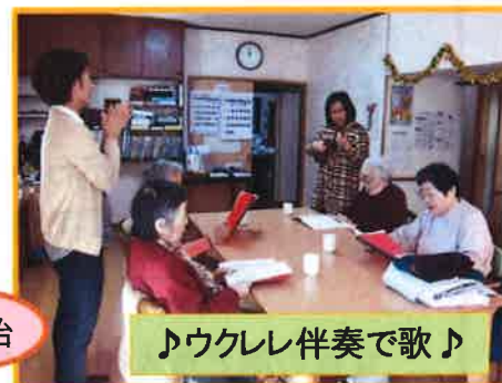
♪ウクレレ伴奏で歌♪