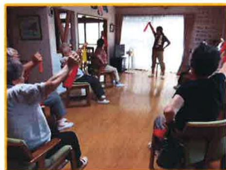
セラバンドを使ってのびのび

12/8に小和田公民館で行われた松浪1丁目、美住町、ひばりが丘のブロック別交流会にて、まつなみクラブの職員が出張し皆さんと一緒に体操をしました。