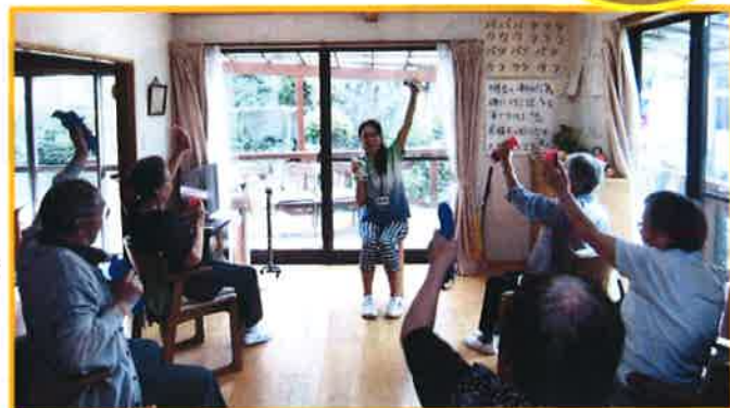
ウェイトを持ってヨイショ！！