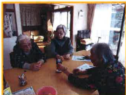
ぐらぐらゲームで盛り上がり