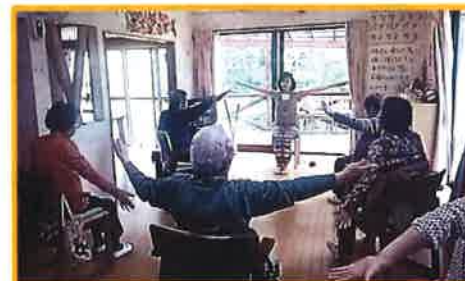
シニアヨガの先生を招いて