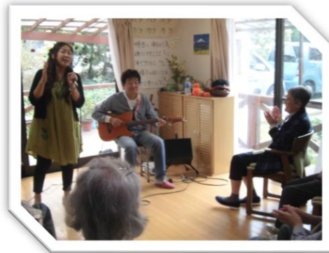
地域交流（音楽ライブ）