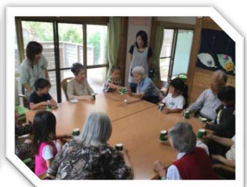
地域異世代交流（保育園児との交流）