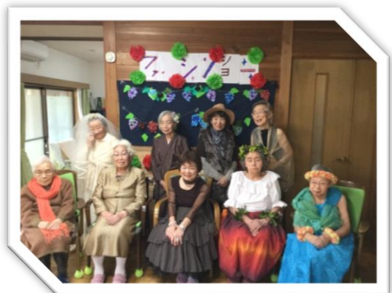
思い出ファッションショー

ここに来るとみんなが自分で出来ることを何かしらやっているからね。自分もやることを探して、私が好きな『掃除』をしています。部屋の中だけじゃなく、庭掃除もやらせてもらえてうれしいです！